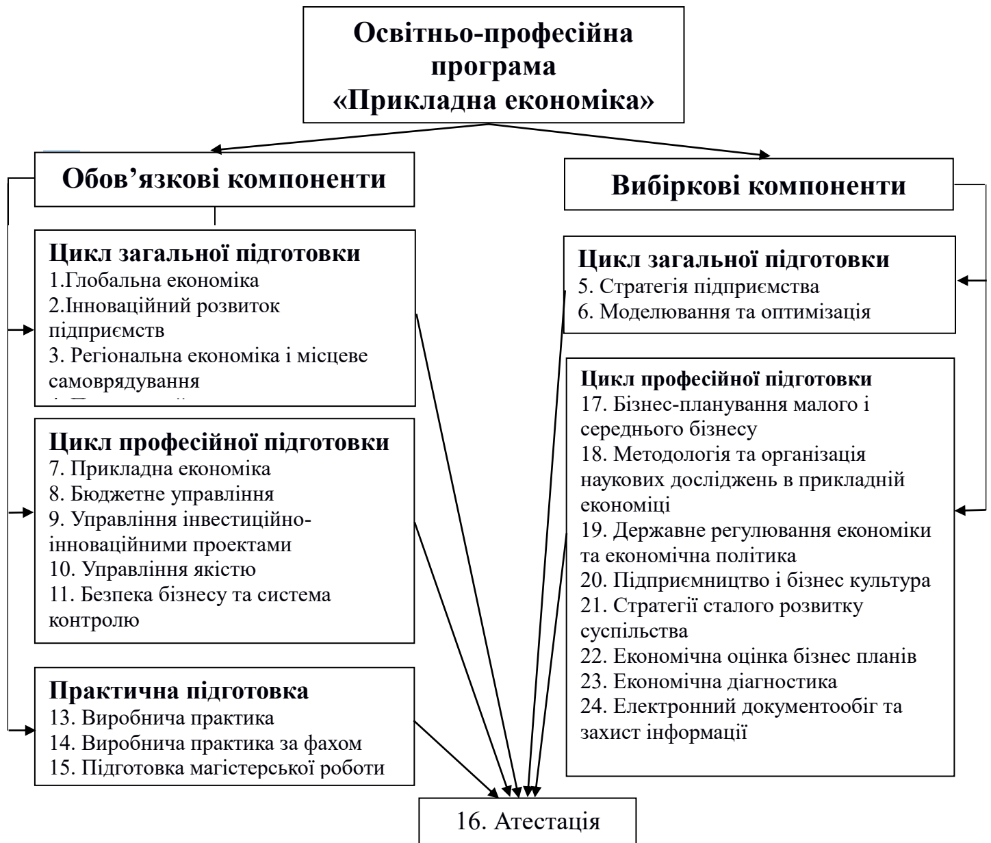
Рис. 1. Схема компонентів освітньо-професійної програми «Прикладна економіка»