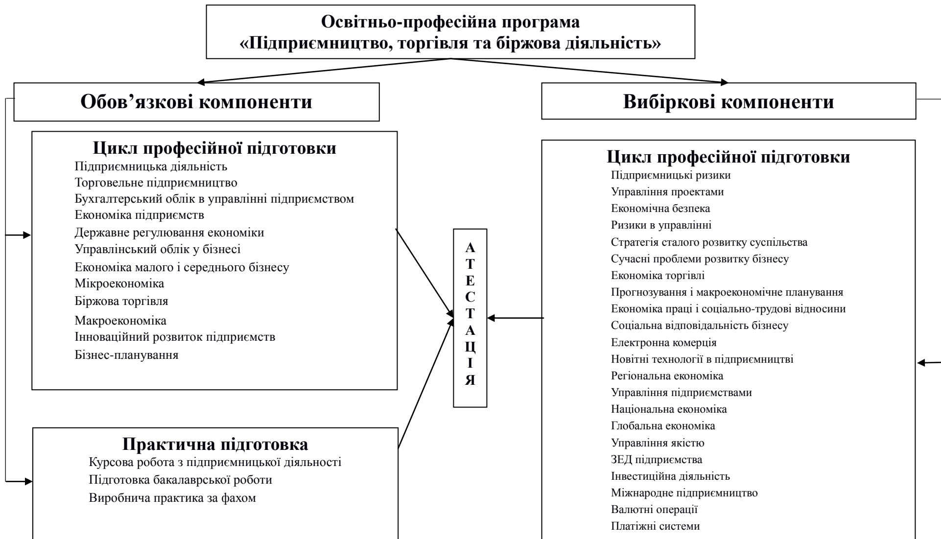
Рис. 2. Схема компонентів освітньо-професійної програми «Підприємництво, торгівля та біржова діяльність» (120 кредитів ЄКТС)